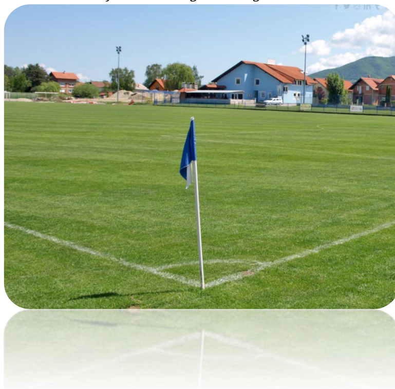
Slika 1. Donja Bistra – nogometno igralište SRC Bistra